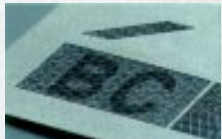
Imagem latente - ao colocar a cédula na altura dos olhos, na posição horizontal, com bastante luz, vamos ver as letras "B" e "C". É o que chamamos de "imagem latente".

Microimpressões - ao utilizar uma lente, vamos notar a presença de pequeníssimas letras "B" e "C", nas faixas clara e escura junto à efígie da República e no interior do número 2.